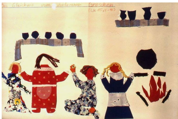
Die Freude über den wiedergefundenen Groschen (Luk 15,8-10)

Was mit dem Wollfadenbild („Kinder und Kirche“ 31) vorgeschlagen war, kann man durch andere Materialien erweitern. So lassen sich biblische Geschichten abwechslungsreicher gestalten. Dazu ein paar Vorschläge, die auch Anregung für weitere Gestaltungen sein können: